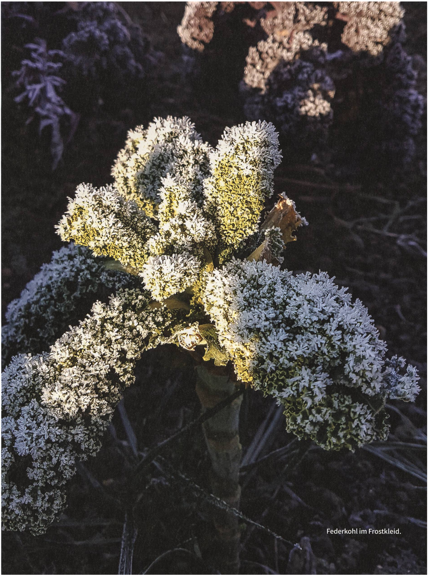
Federkohl im Frostkleid.