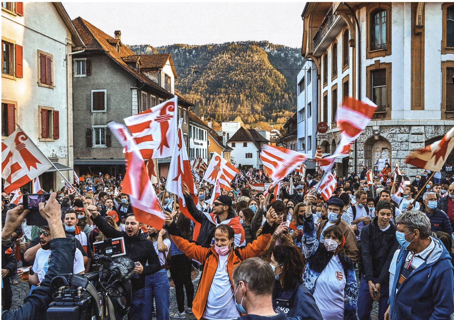
Die Feiernden am Abend des 28. März 2021 in der Gasse vor dem Hôtel de Ville, dem Rathaus von Moutier.

Die Gründer kamen von Norden aus dem Elsass, sie folgten flussaufwärts dem Lauf der Birs. 2008 fand man bei Bauarbeiten in der Altstadt Mauerreste des 640 entstandenen Klosters Moutier-Grandval. 999 vermachten es Burgunder-