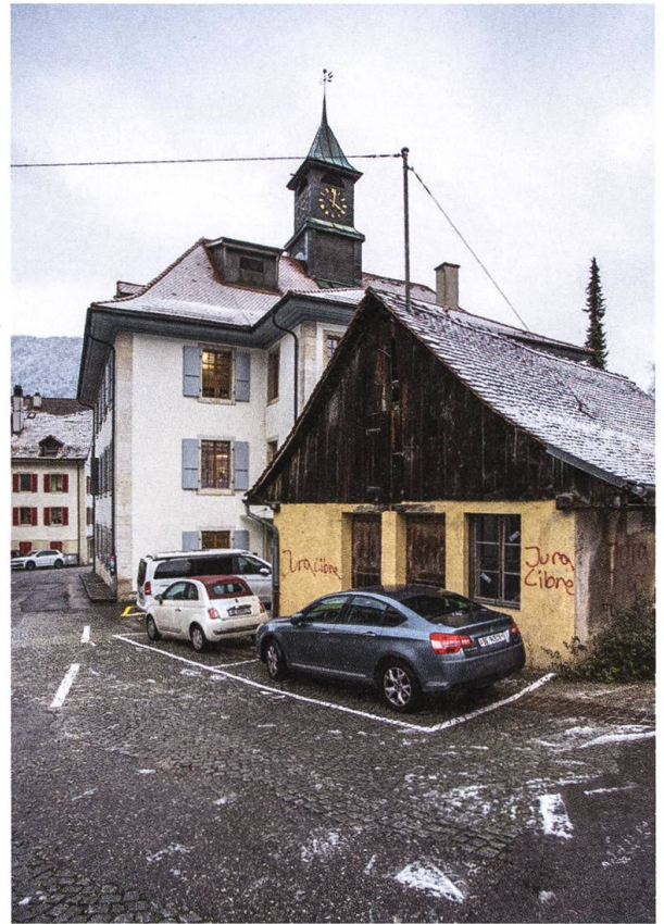
Das etwas heruntergekommene, zerstrittene Moutier.

Die Interjurassische Versammlung, die unter der Ägide der Eidgenossenschaft den Jurakonflikt beenden sollte, kühlte die Glut ab. Sie gleiste die finale Abstimmung vom 24. November 2013 auf, welche die Lage im Jura klären