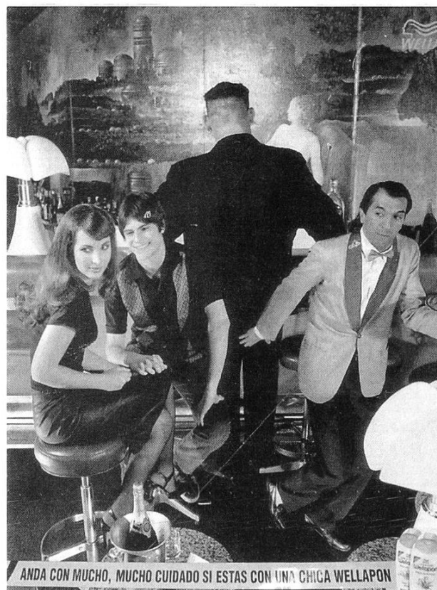
Anuncio 8: Wellapon, en: Cosmopolitan , noviembre de 1999, núm. 11, 211.