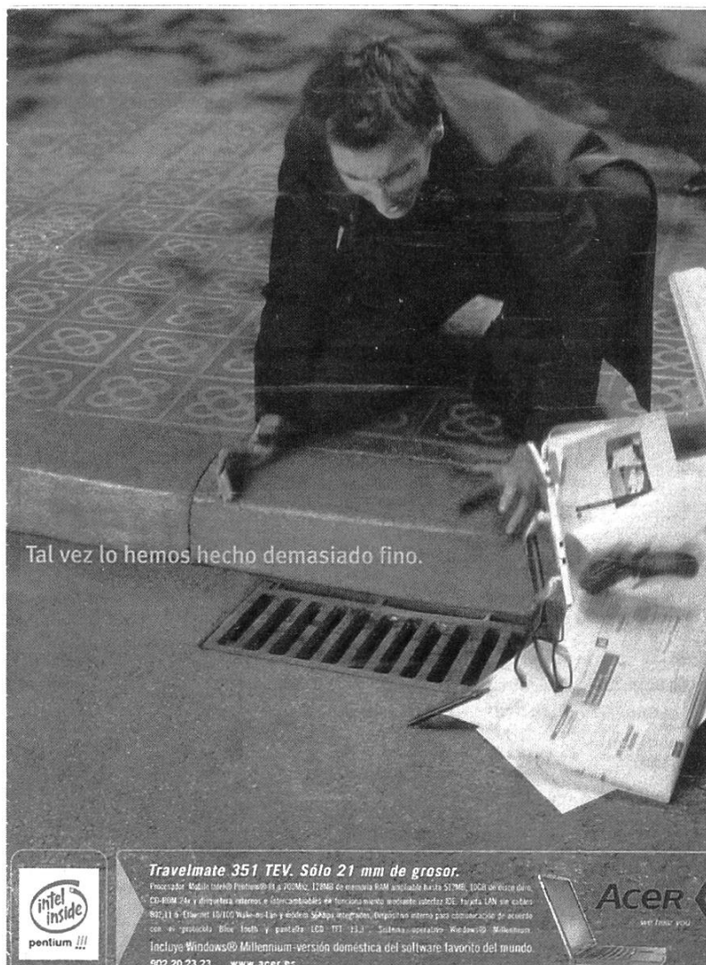
Anuncio 7: Acer, en: Quo , diciembre de 2000, núm. 63, 19.