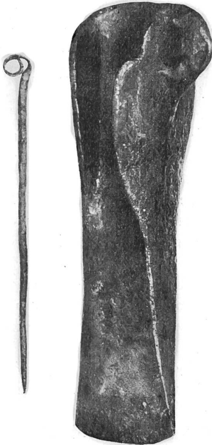
Thierachern Nadel und Axt.

dern auch die genauen Fundangaben und die Führung nach der Fundstelle. Zusammen mit Kohlenresten und einem angebrannten Stück Holz fand sich eine Rollennadel, die ans Ende der Bronzezeit zu setzen ist, etwa 300 m entfernt eine Lappenaxt von dem Typus, den man jetzt allgemein als oberständige Lappenaxt bezeichnet. Solche Stücke gehören