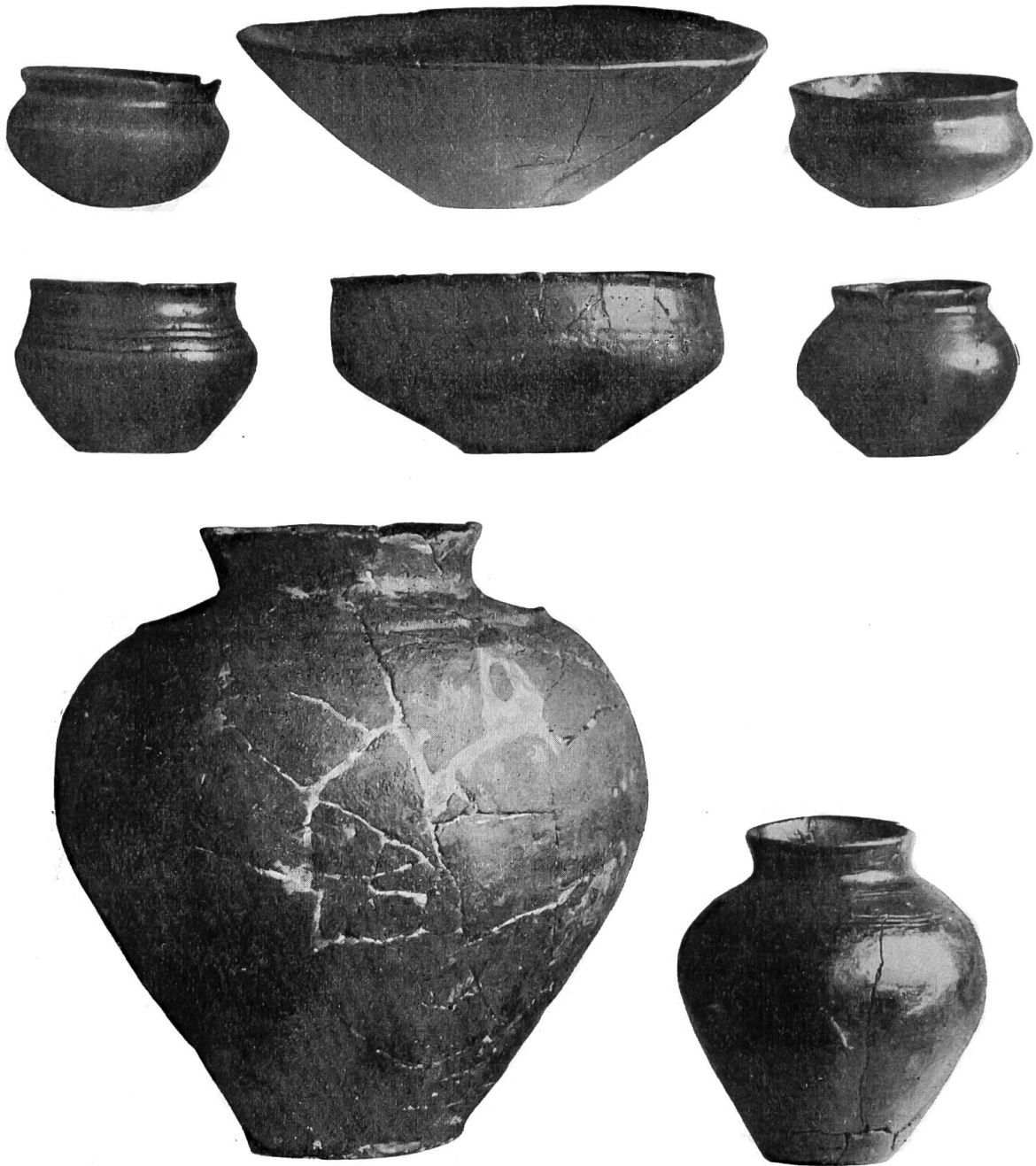
Lyssach. Urnen und Schalen.