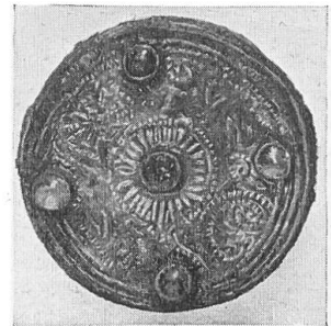
Funde aus dem alamannisch-burgundischen Gräberfeld von Bümpliz