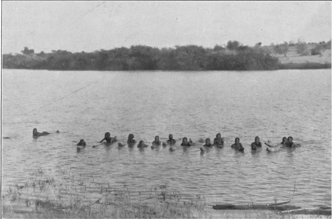
Abbild. 1. Knaben mit Schwimmhölzern bei Fort Bol am Ufer des Tschadsees.