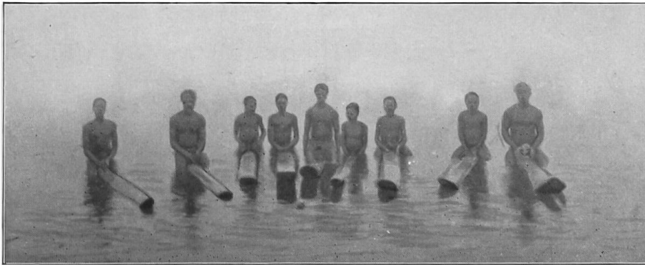
Eingeborne auf Schwimmhölzern reitend. Bosonotwe-See. Goldküste.