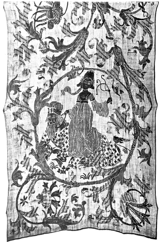
Leinenstickerei mit Wappen Lyb und Mesnang 1510.