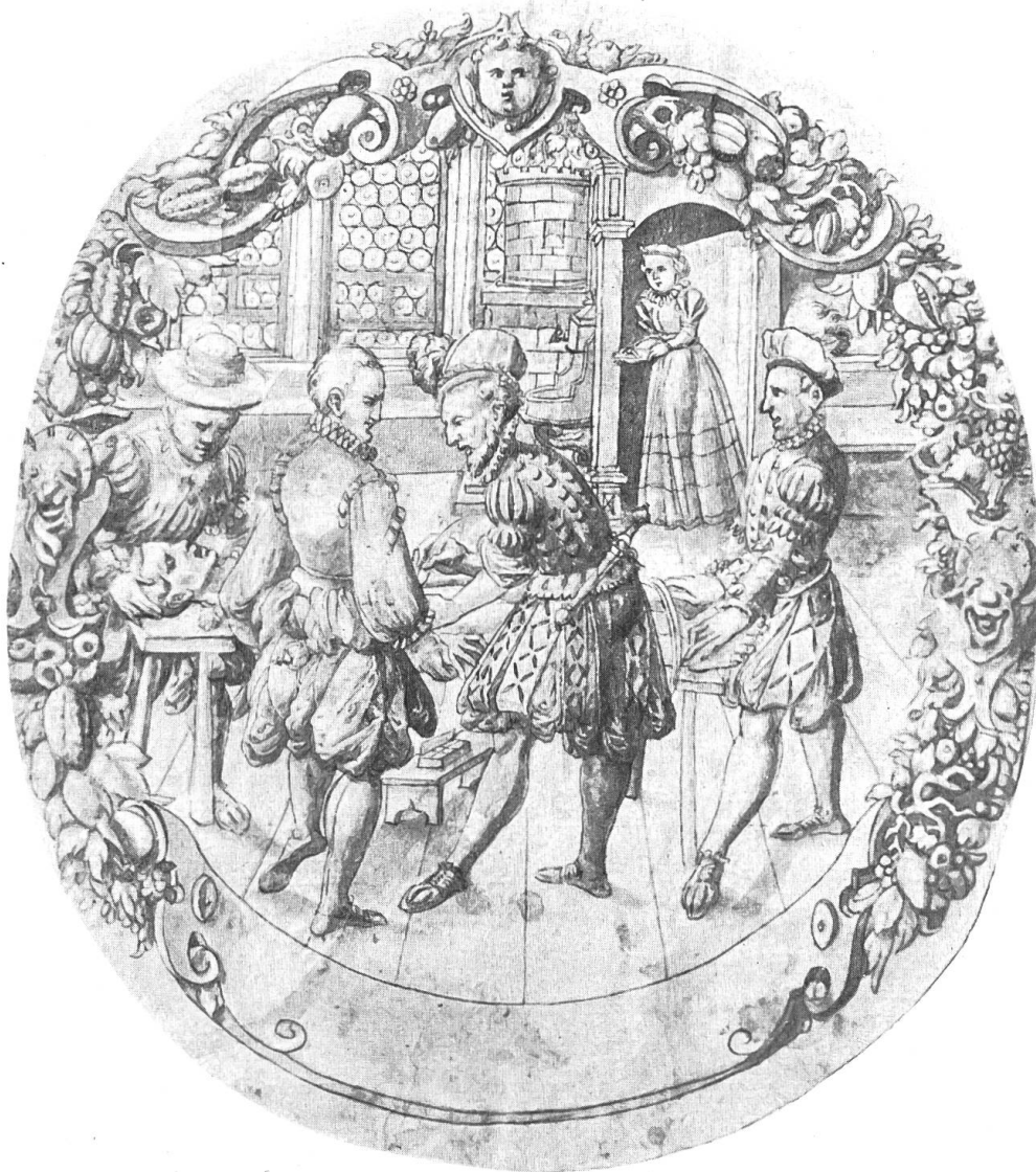
Scheibenriss mit Darstellung einer Operation. 16. Jahrh. Ende.

Fünf Schlichscheiben aus der Sammlung Lotmar gehören mit zwei geschliffenen Wappenscheiben Zehender zum Schönsten, was diese leider nicht mehr geübte Technik hervorgebracht hat und stehen auch künst-