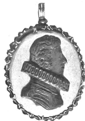
Anhänger. 16. Jahrh. Ende.