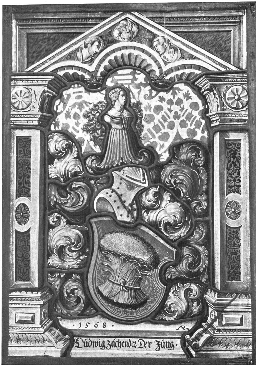
Ludwig Zehender. 1568. Von Abraham Bickart.