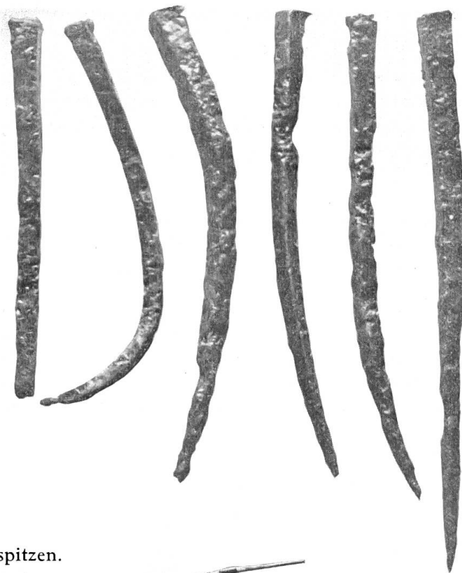
Keltenwall. Eisenspitzen. 1/3 nat. Grösse.

Da in den nächsten Jahren an dieser Stelle weitere Grabungen vorgesehen und von der burgerlichen Forstverwaltung in verdankenswerter Weise zugesichert sind, können wir uns mit diesem vorläufigen Fundbericht begnügen.