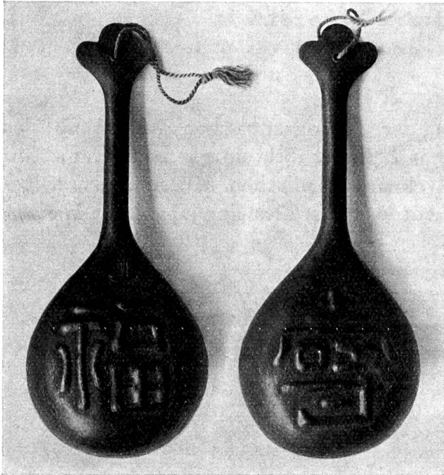
Abb. 2. Eiserne Handglocke (Myochin=Meister).

Diese einzelnen gewölbten Schiebepplatten laufen an glattgeschmiedeten Achsenknöpfen an den beiden seitlichen Mittelpunkten des Schädelbandstreifens. Sie sind vertikal unter sich verbunden durch feine, schmale Lederriemchen, die an gleichmässig abstehenden Ösen der Platten und des Schädelbandstreifens befestigt sind.