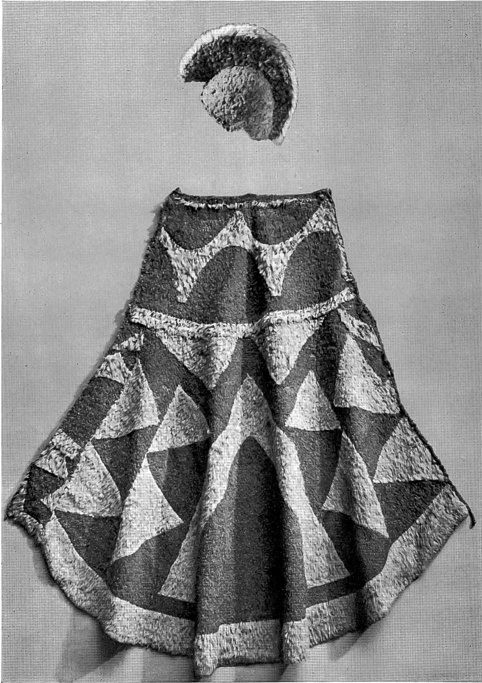
Königsornat aus Hawaii (Federmantel und -helm), 18. Jahrh. Sammlung Wäber.