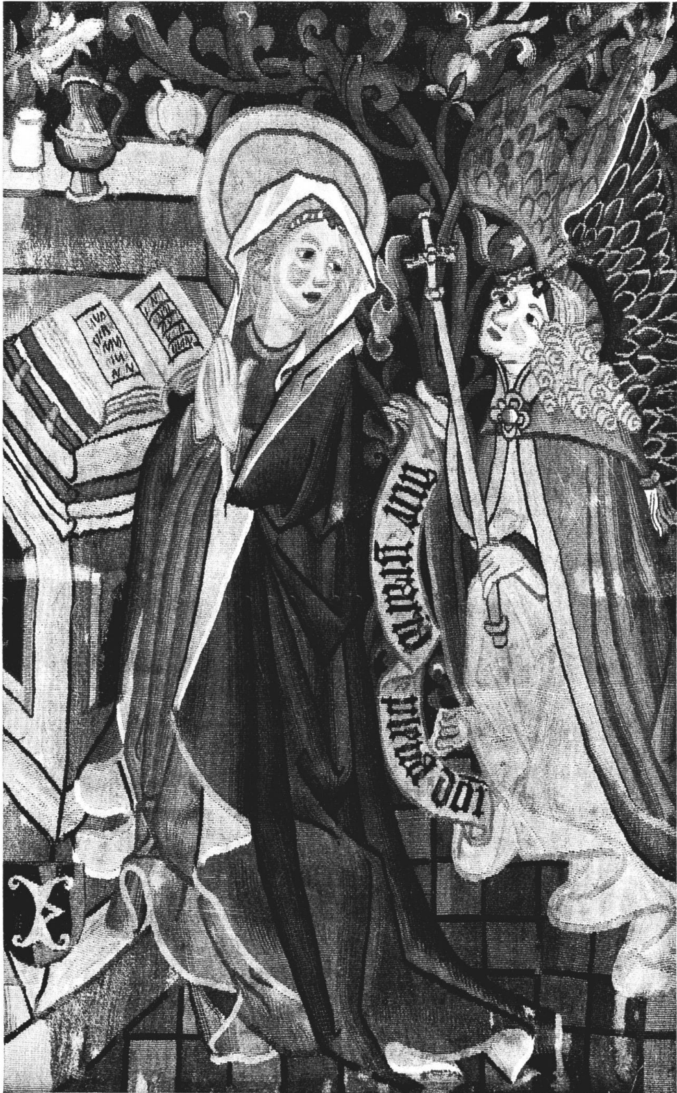
Abb. 1. Verkündigung an Maria, Teppichfragment, 1470/1490, Bernisches Historisches Museum