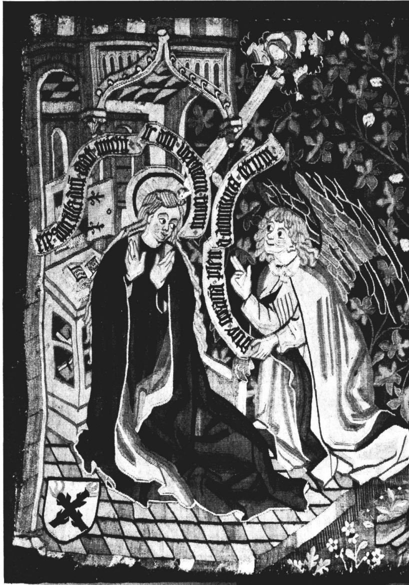
Abb. 3. Antependium, ehem. Klosterkirche Rheinau, Ausschnitt, um 1470, Schweiz. Landesmuseum, Zürich

lich höheren und weiter gefaßten Bildraum, in dem die Figuren kleiner und im Verhältnis zur gesamten Höhe auch proportionierter erscheinen, als in unserem Teppichfragment. Die Wirkung der in der räumlichen Tiefe und Höhe weiter begrenzten Bildbühne wird durch den grüngelben, mit übereck gestellten Fliesen belegten Fußboden noch verstärkt.