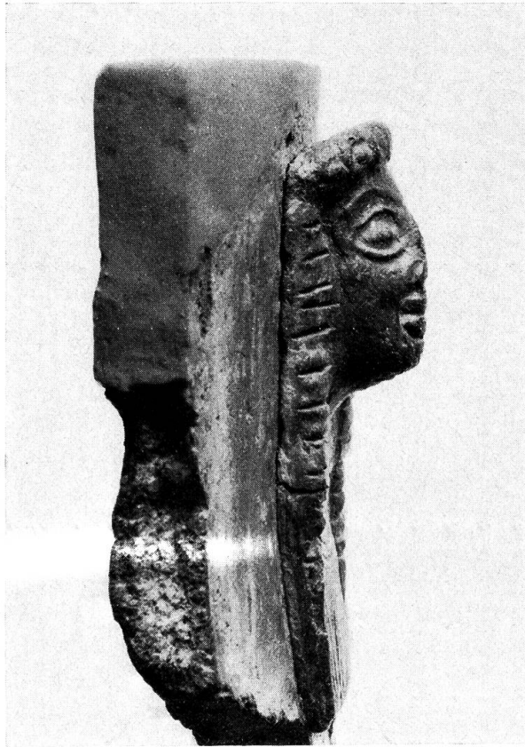
Abb. 2. Fragment einer kretischen Sphinx, Profilsicht

gehört dem siebenten Jahrhundert v. Chr. an, der schöpferischen, glanzvollen nachminoischen Epoche der Insel, die nachher aus noch immer nicht restlos geklärten Gründen in ein politisches und kulturelles Schattendasein versank 5 . Die einzelnen Schmuckelemente für die Reliefs wurden vom Töpfer aus Formen gewonnen, frei auf die Wandung des noch feuchten Topfes aufgesetzt und mit Modellierholz und kleinen Stempeln überarbeitet. Für unsere Sphinx hat der Künstler