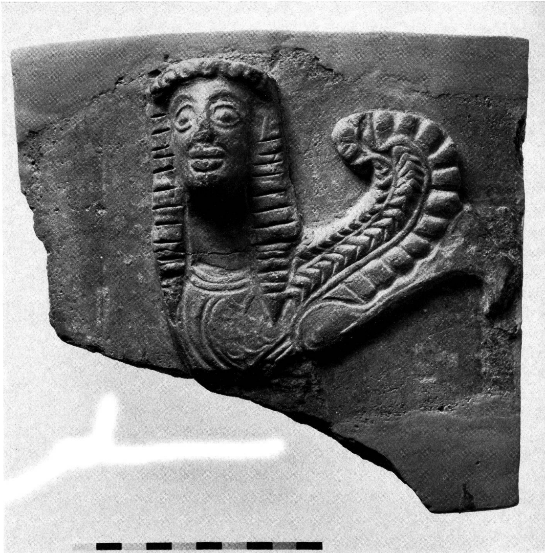
Abb. 1. Fragment einer kretischen Sphinx

abgelegenen Gegenden Kretas und Zyperns in Töpferfamilien von Generation zu Generation weitergegeben wird 3 . Die Form der archaischen kretischen Pithoi hat nicht mehr jenen etwas spannungslosen ovalen Umriß der vorgriechischen, sondern wandelte sich durch die Jahrhunderte zu der gestrafften, wohlgegliederten Amphore mit birnförmigem Körper, abgesetztem kräftigem Hals und zwei symmetrischen Halshenkeln (Abb. 3) 4 . Die große Menge der prächtigen, reliefgeschmückten Pithoi