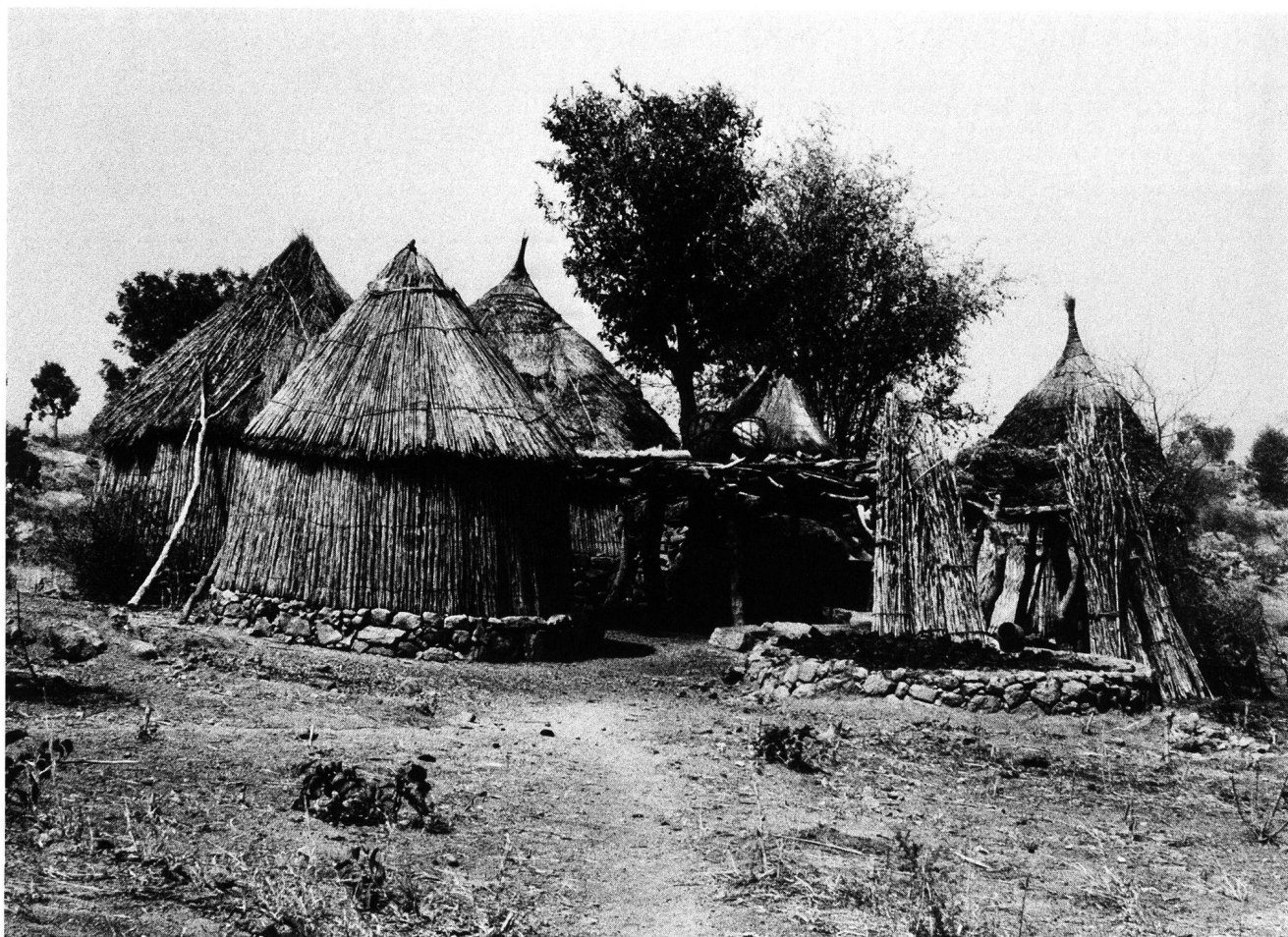
Abb. 2. Gehöft der Zulgo in Mambeza; rechts die Fundamente eines Hauses.

dass ein Spezialist für diesen Fang zuständig ist: Es handelt sich um den ranghöchsten Senior, der für alle Zeremonien als eine Art Hauptpriester tätig ist. Gemäss seiner Schilderung erfolgt die Jagd auf den Klippschliefer, wara kotchom , frühmorgens. Der Jäger, bewaffnet mit Lanze und Pfeilen und in Begleitung seiner Hunde (Abb. 4), sucht die von den Tieren bewohnten Felsregionen auf. Er erzeugt durch Steinwürfe Lärm, worauf die erschreckten Klippschliefer ihren Bau verlassen und von den Hunden erst gejagt und dann geschnappt werden. Nur im Notfall wird der Jäger von der Lanze oder den Pfeilen Gebrauch machen und dann darauf achten, dass das Tier nur leicht verletzt wird. Ist der kotchom gefangen, werden Vorder- und Hinterbeine gefesselt und die Schnauze zugebunden; so trägt ihn der Jäger auf besondere Art, indem er mit der rechten Hand die Schnauze umfasst und den Leib unter den linken Arm klemmt. Im Gehöft angekommen, wird der kotchom in einen grossen Topf, den man mit einem Stein verschliesst, gesperrt. Bis zum Ritual wird das Tier im Topf an einer ganz bestimmten Stelle im Speicherraum, nämlich neben den Kultutensilien, aufbewahrt.