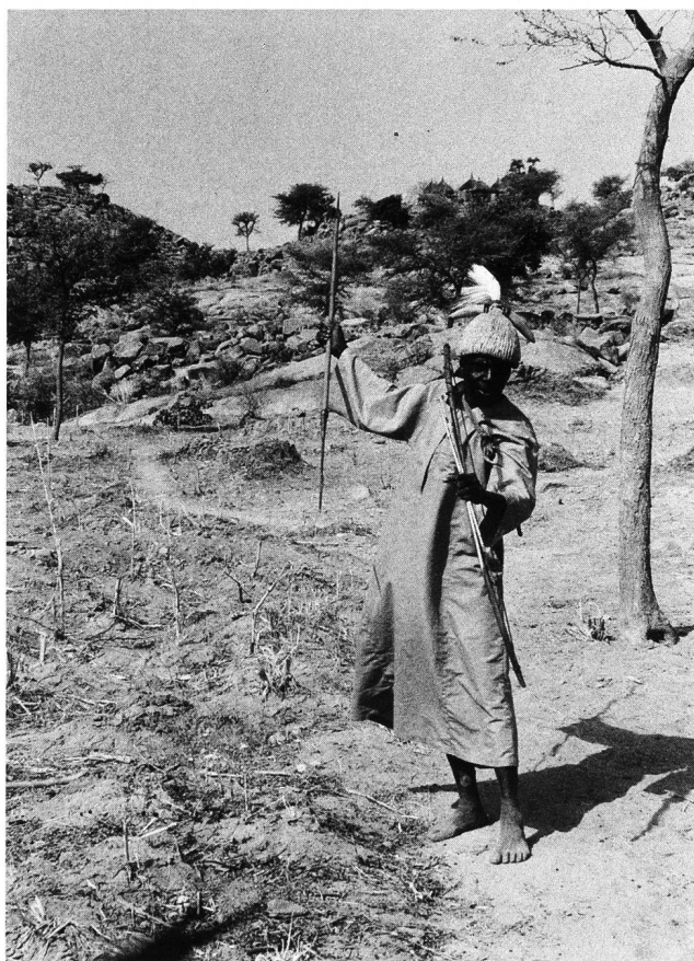
Abb. 4. Jagd- und Kriegsausrüstung mit Hut, Lanze, Bogen und Pfeilen.

den. Diese Prozedur wurde wiederholt, nur dass diesmal die ausgerissenen Haare in die mit Wasser gefüllte und mit den zwei Pulvern versetzte Kalebasse gegeben wurden. Nachdem der mala kuli das Tier dem Hausherrn wieder übergeben hatte, nahm er aus der Kalebasse einen Schluck und blies das Wasser aus seinem Mund ins Loch. Weiteres Wasser aus der Kalebasse wurde nachgegossen. Nun versammelte er die Frauen in einiger Distanz vom mazam und übernahm das Tier wieder vom Hausherrn. Er hielt es hoch und beschrieb damit zweimal über den Köpfen der Frauen kreisförmige Bewegungen, gefolgt vom Umfahren der rechten Beine der Patientinnen. Anschliessend wiederholte er diese Zeremonie mit dem Chef und dessen Sohn, wobei aber mit dem Klippschliefer sechsmal über die Köpfe und ebenso oft um die linken Beine gefahren wurde. Nach dieser Aktion hielt der mala kuli den kotchom ins Loch des Altars und berührte die Lanze mit dem Tier. Erneut spritzte der Assistent Wasser aus seinem Mund erst auf das Tier, dann in das Loch und schliesslich auch auf die Versammelten. Er riss einmal mehr Haare aus dem Fell des Klippschliers sowie des Ziegenfusses und deponierte sie, mit rotem und grauem Pulver vermischt, im Loch des Altars, welcher anschlies-