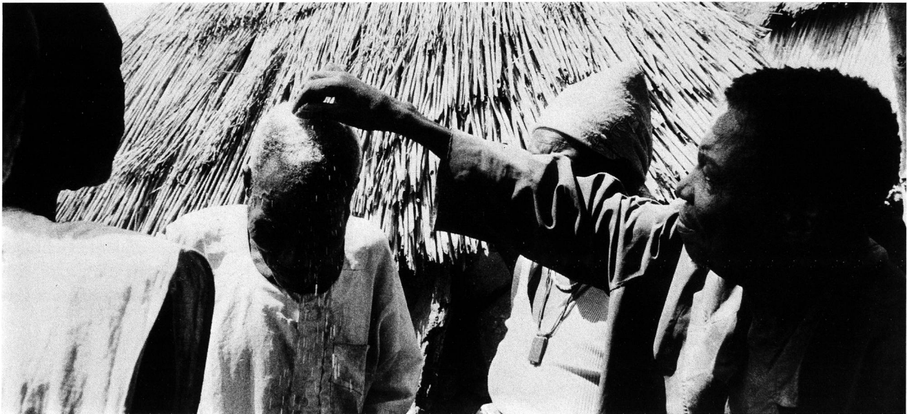
Abb. 5. «Medizinisches» Pulver wird auf den Kopf gestreut.

Arm. Weiter stopfte er den Anwesenden etwas von den Hirseklößen in die Nasenlöcher (der Schreibenden allerdings nicht, da die Prozedur schmerzhaft sei). Es folgte die eigentliche Mahlzeit, an der die Hauptpersonen, der Chefsohn und die zwei alten Frauen, nicht aber die jungen Frauen und das Kind, teilnahmen.