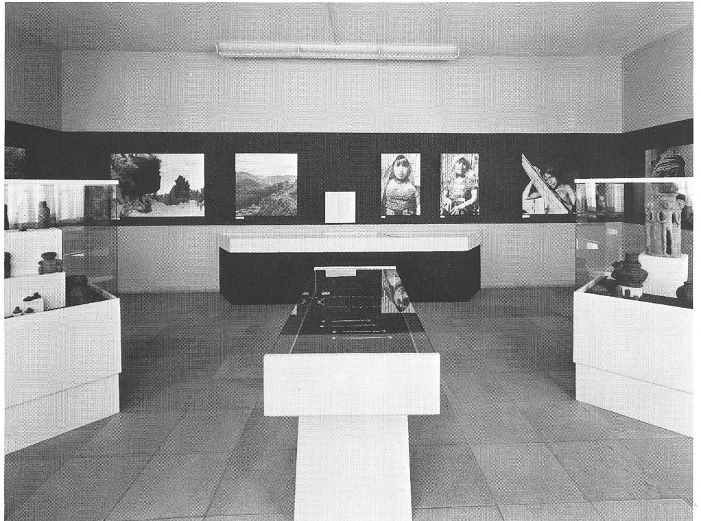
Blick in die vom Schweizerischen Bankverein organisierte Wanderausstellung präkolumbischer Goldschmiedearbeiten und Keramik aus dem «Museo del Oro» in Bogota (1975)