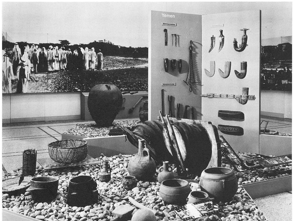
Ausstellung «Südarabien» (1972|73) (vgl. S. 105f.)