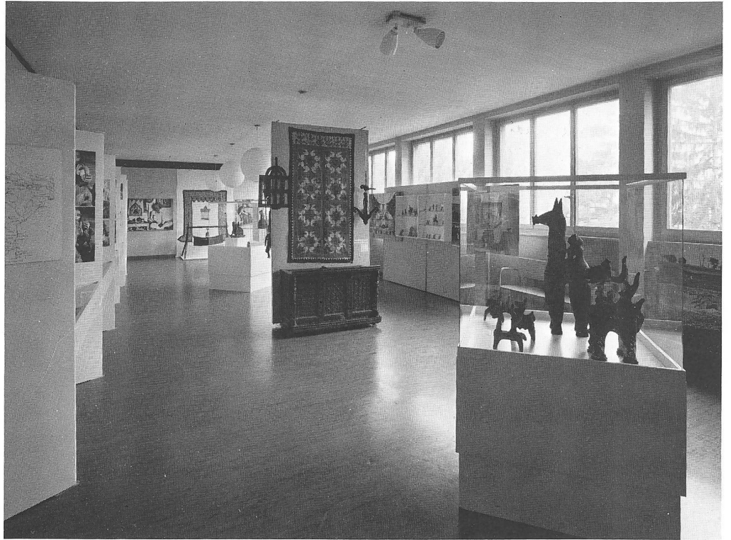
Ausstellung «Unbekanntes Indien» in der Schulwarte (1973) (vgl. S.112)