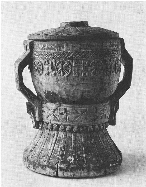
Mörser mit Deckel, Nuristan/Afghanistan (vgl. S. 115)