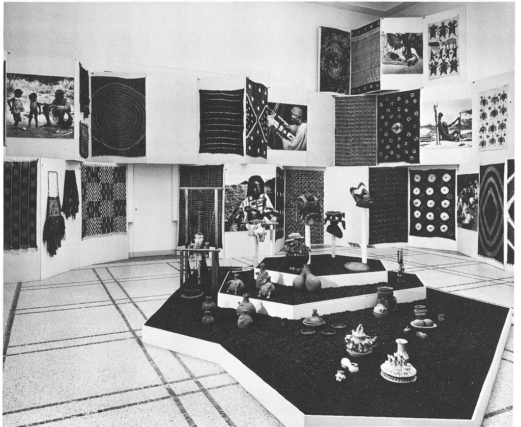
Ausstellung «Westafrikanische Handwerker» (1974|75) (vgl. S. 112)