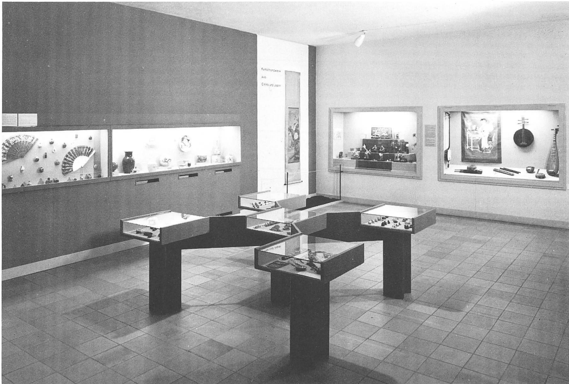
Ausstellung «Kunsthandwerk aus China und Japan» (1971–1974) (vgl. S.105)