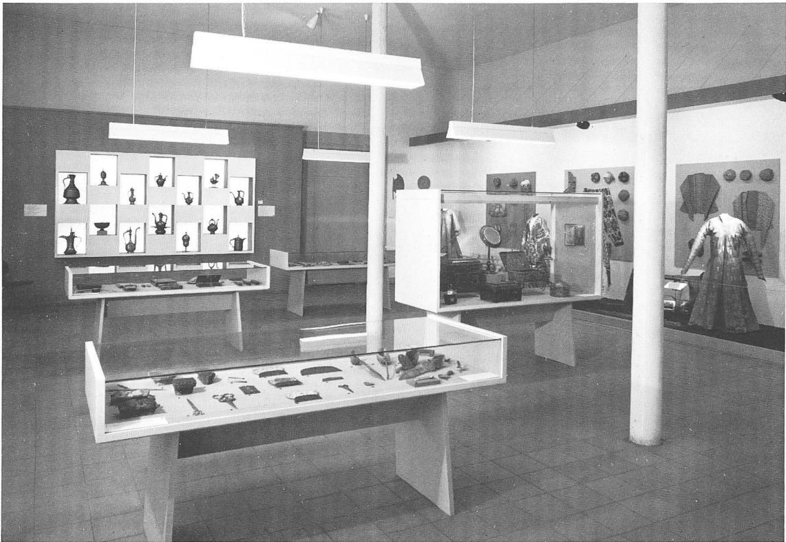
Blick in die 1971 eröffnete Ausstellung «Islamisches Kunsthandwerk» (vgl. S.105)