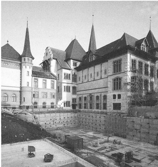
Die Depotgeschosse liegen unter dem Ausstellungssaal im Boden.