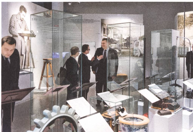
Der Vize-Aussenminister der Republik Weissrussland, Oleg Kravchenko, im Dialog über Albert Einstein.