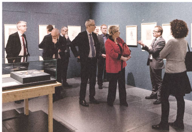
Der Berner Regierungsrat in Niklaus Manuels Zeichnungswerkstatt.

Im Dezember 2017 besuchte der weissrussische Vize-Aussenminister Oleg Kravchenko in Begleitung der stellvertretenden Staatssekretärin Krystyna Marty des Eidgenössischen Departements für auswärtige Angelegenheiten (EDA) das Einstein Museum. Nach der Führung mit dem Direktor hielt der Vize-Aussenminister aus Weissrussland im Gästebuch fest, dass er sich privilegiert fühle, Wissenswertes jenseits des allgemein Bekannten über diesen vielleicht einflussreichsten Wissenschaftler der Welt erfahren zu haben. Es folgte der Besuch der Aussenministerin der Republik Andorra Maria Ubach Font in Begleitung von Botschafter Nicolas Brühl, Chef der Abteilung Europa in der Politischen Direktion des EDA. Auch die andorranische Aussenministerin bedankte sich «infiniment» für die anregende Führung mit einem Gästebucheintrag.