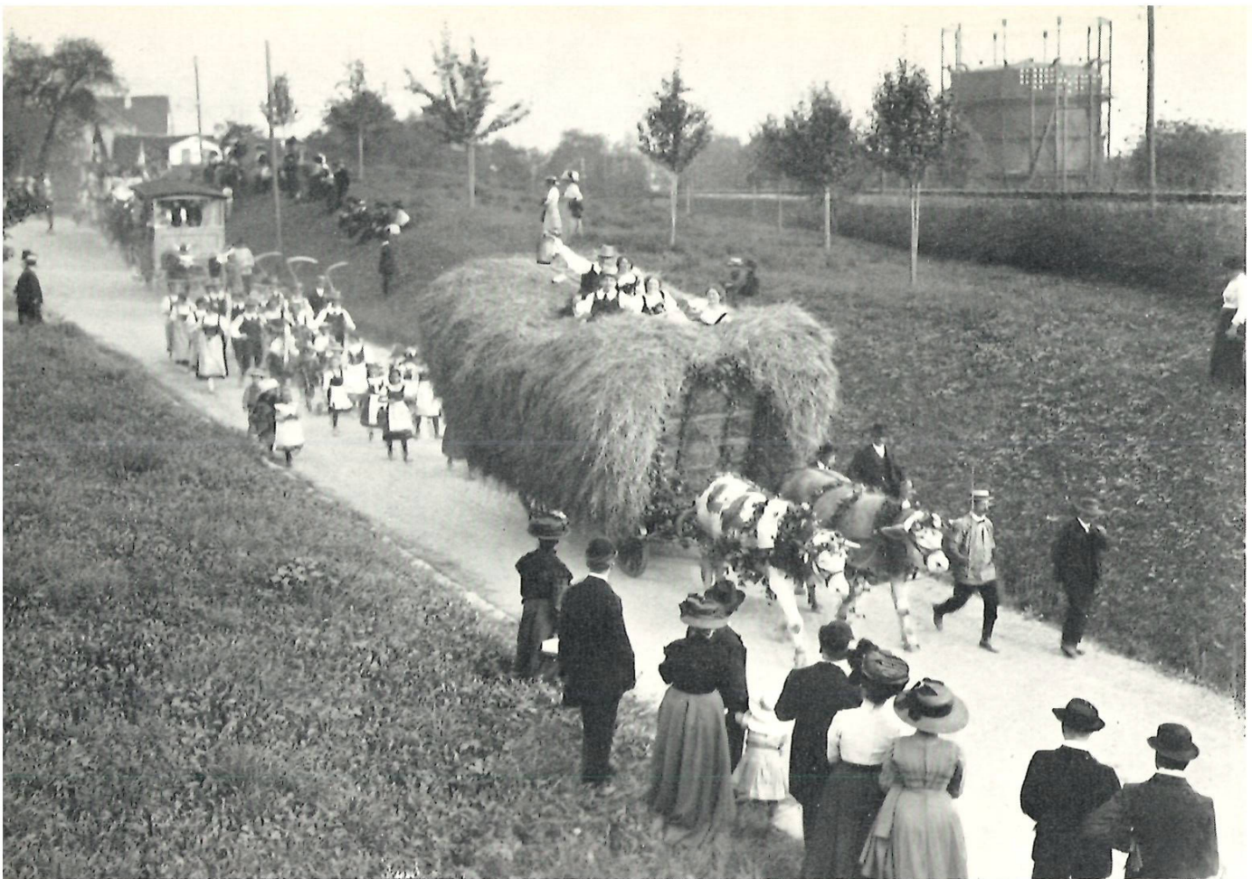
Der Umzug auf der Bergstrasse in Obermeilen