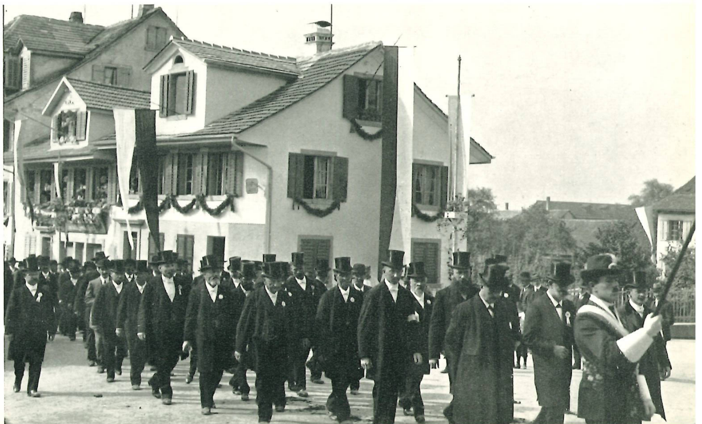
Die Offiziellen im Festzug am Kreuzplatz und in der Kirchgasse