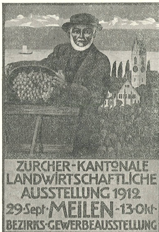
Titelblatt des Ausstellungskataloges von 1912, von J. Ammann, Obermeilen

Die schlechte Witterung beeinträchtigte den Besuch der Ausstellung und das finanzielle Ergebnis. Statt einem Gewinn entstand ein kleines Defizit von etwa 2000 Fr., das der Landwirtschaftliche Verein zu bezahlen hatte; man bedauerte, den Mitwirkenden nicht die kleinste Entschädigung ausrichten zu können. In deren Erinnerung blieb die Ausstellung 1912 trotzdem ein hell leuchtendes Ereignis.