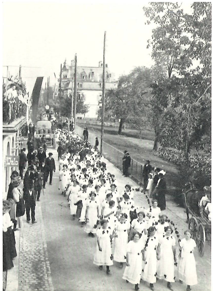
Der Festzug auf der Dorfstrasse bei der «Steinburg». Rechts freies Wiesengelände bis zum noch nicht aufgestockten Hotel «Bahn- hof»