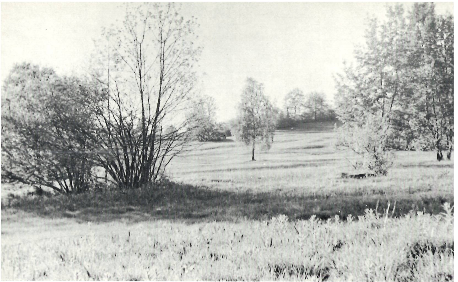
Betzibüel-Ried — Geschützte Baumreihe an der Pfannenstielstrasse