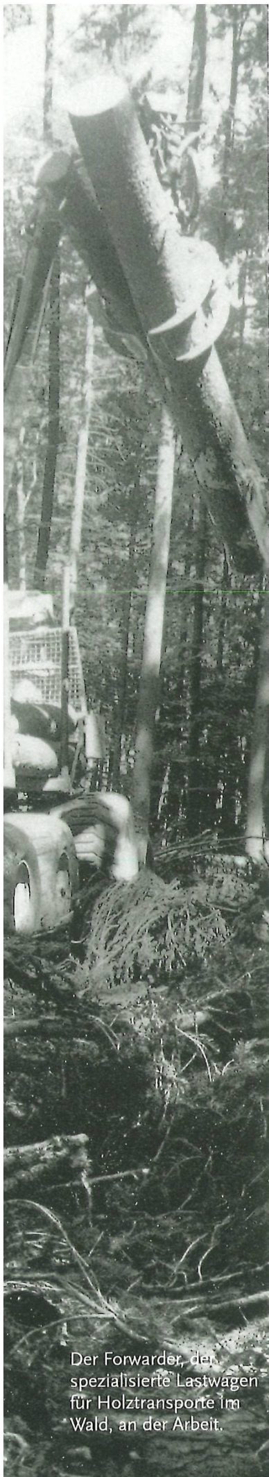
Der Forwarder, der spezialisierte Lastwagen für Holztransporte im Wald, an der Arbeit.

den Förstern und Waldbesitzern auch angewendet wird.