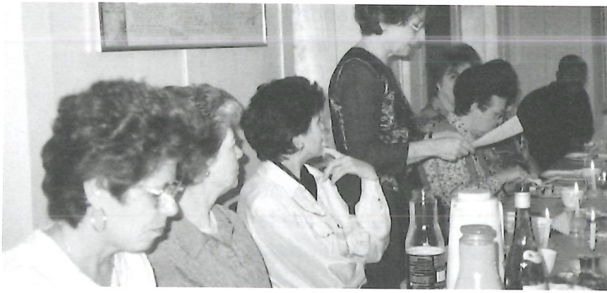
Schällenhäus: Jahresabschlussfest der Deutsch- und Zürichdeutsch-Kurse.

30 Jahre nach der Gründung ist die Sprachschule der Frauenvereine Meilen zu einer etablierten Institution geworden. Der Umfang sowohl im Kursangebot als auch im Lehrkörper hat sich kaum mehr geändert. Die Schule genießt weiterhin den Ruf, dass hier professionell, aber gleichzeitig überaus flexibel unterrichtet wird. So konnte eine Englischgruppe auf Wunsch bis zur Volkshochschul-Zertifikats-Prüfung geführt werden, während andere Klassen manchmal eine langsamere Gangart bevorzugen und ein paar Wiederholungsstunden einschalten, um dann später wieder ein zügiges Tempo anzuschlagen. Dass das Gesellige nicht zu kurz kommt, beweisen die vielen gemeinsamen Unternehmungen ausserhalb der Unterrichtszeit: Reisen ins entsprechende Sprachgebiet, Theaterbesuche und Feste ergänzen und bereichern die Schulstunden. So macht Lernen Spass!