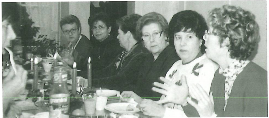
Schällenhau: Jahresabschlussfest der Deutsch- und Zürichdeutsch-Kurse.

Der Anfang war alles andere als einfach. Viele Zweifel mussten aus dem Wege geräumt werden. War eine solche Schule in Meilen nötig? Warum sollte das gerade die Aufgabe der Frauenvereine sein? Woher wollte man das Startkapital nehmen? Doch die Initiantin liess sich nicht beirren. Sie war überzeugt, dass nur eine lokale Schule mit Unterrichtszeiten vor allem am Morgen die Frauen zur Teilnahme bewegen konnte. Anfänglich unterstützte das Brockenhaus Meilen, ebenfalls eine Institution der Frauenvereine, das neue Projekt finanziell, später wurde es trotz des moderaten Kursgeldes selbsttragend.