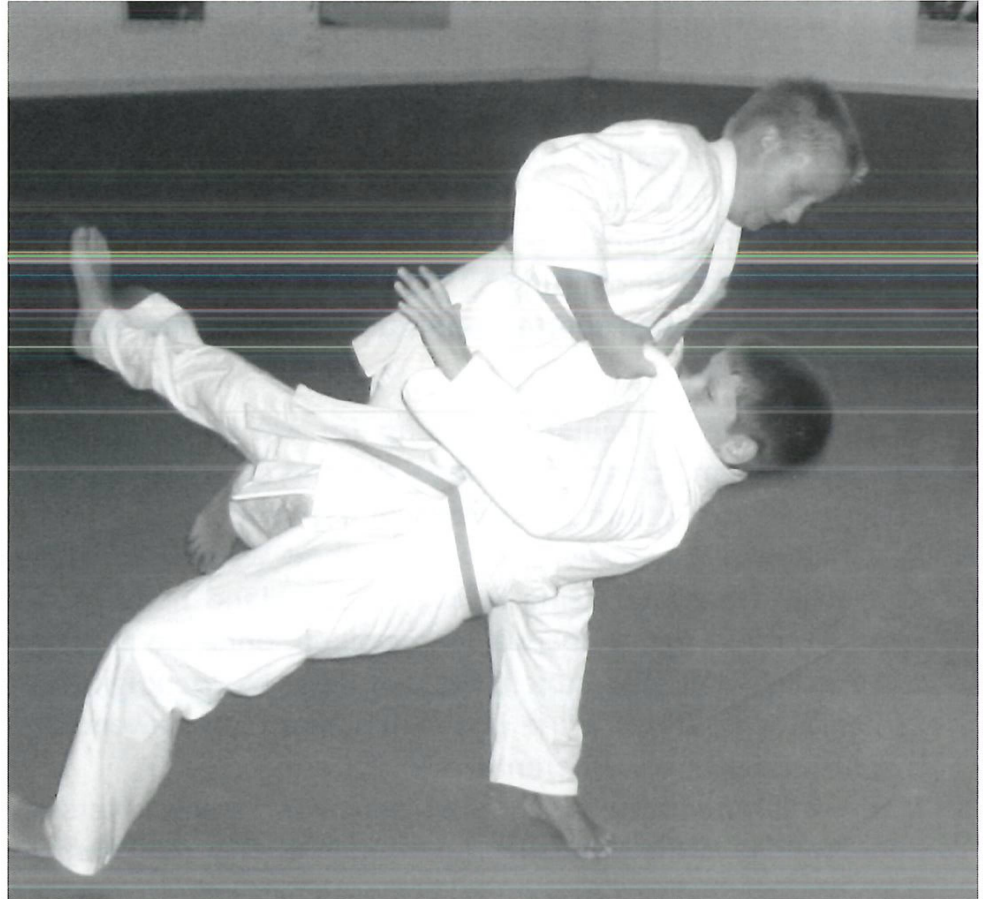
Kinderjudo, erste Übungen einer Wurftechnik.

kunst mit Waffen) bedeutet. Den Höhepunkt erlebte Ju-Jitsu gegen Ende des 18. Jahrhunderts, als es während der Tokugawa-Zeit mehrere hundert verschiedene Schulen (oder Systeme) gab und viele ihrer Lehrer berühmt wurden. Die Lehren und Geheimnisse dieser Meister kreisten dabei alle um das Prinzip von «Nachgeben ist Stärke» und trachteten nach dem hohen Ideal des Budo (oder Bushido), dem Weg des Kriegers. Grundsätze, welche teilweise auch heute noch genau dem Geist des Kodokan-Judo entsprechen.