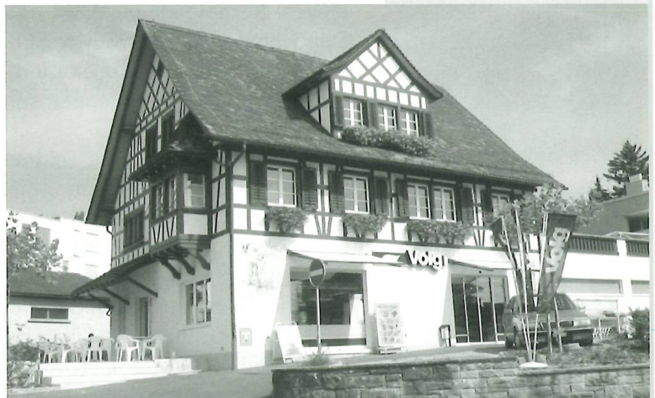
Auf der Halten öffnet der nach dem Umbau doppelt so grosse und mit einer Kaffee-Ecke versehene «Landi» neu die Tore.