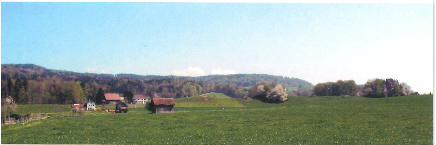
Der Neuhof und Haus Schoris, vom Trüggelerweg aus gesehen.