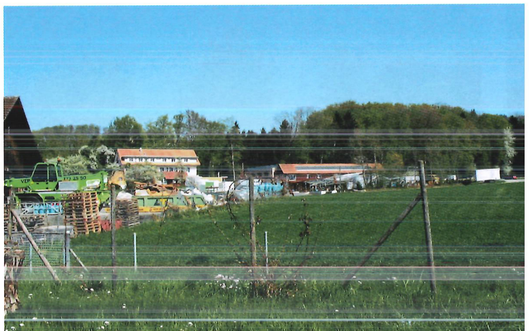
Magazin und Lagerplatz der Firma Tüscher.