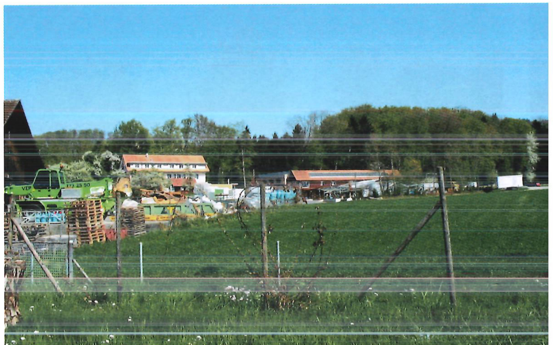
Magazin und Lagerplatz der Firma Tüscher.