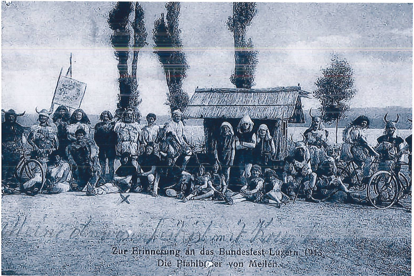
Die Meilemer Velofahrer 1913 als Pfählbauer.

Die frühen Jahre Das älteste vorhandene Fotodokument datiert aus dem Jahre 1910 und zeigt die Vereinsmitglieder vor dem Start des Klubrennens Meilen–Tiefenbrunnen–Meilen. Damals gab es weder Carbonrahmen noch Velohelme, und die Seestrasse war als Naturstrasse eine staubige Angelegenheit. Geteert und gepflästert wurde sie erst ab den zwanziger Jahren.