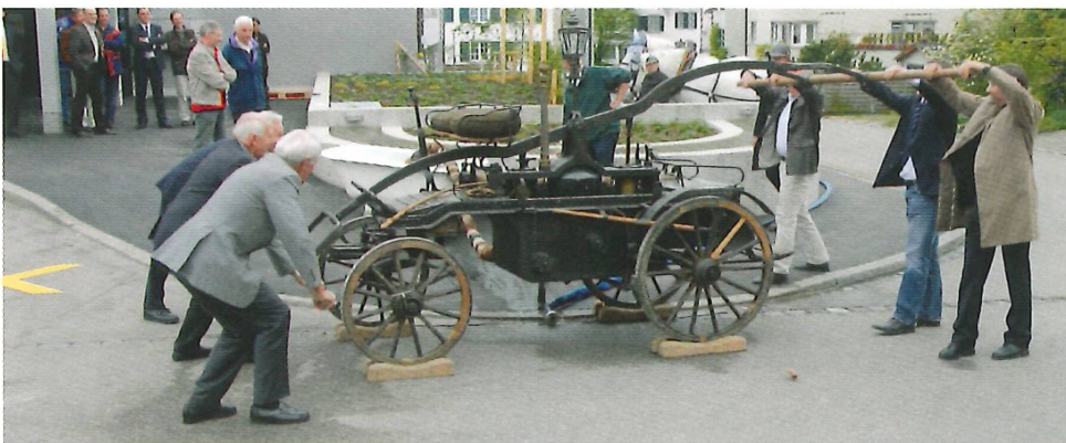
Die EWM AG erhält für ihren sanierten Altbau an der Schulhausstrasse das Minergie-Label. Für die Bevölkerung wurde zudem direkt vor dem Haus ein halbkreisförmiger Betonbrunnen erstellt.