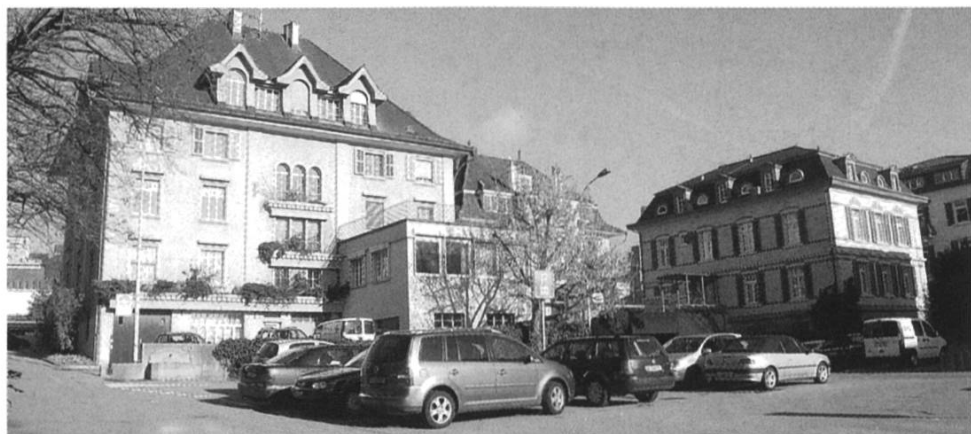
Gemeindehaus mit Gemeindehaus-Parkplatz.