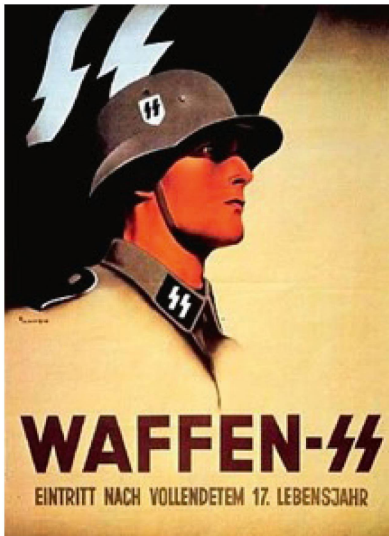
Werbeplakat der Waffen-SS.