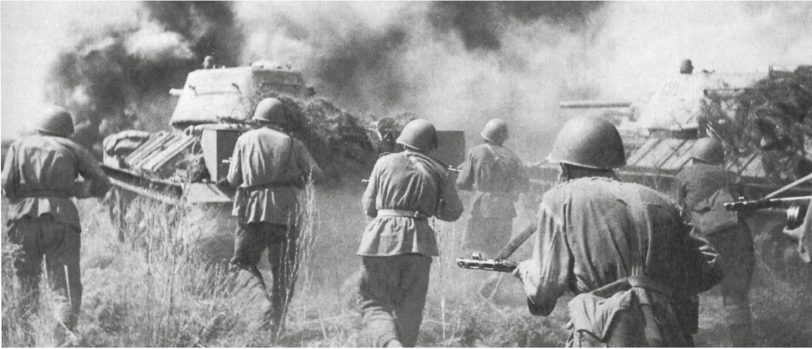
Sowjetische Truppen und Panzer bei einem Gegenangriff in Kursk im Juli 1943.

«[Wir reihen] uns ein in den gewaltigen Heerbann derer, die Europa vor der Gefahr des Bolschewismus retten wollen!»