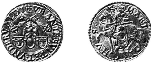
SLM, 3,42 g, 22 mm (Au) †

a Vs. Münzbild ähnlich wie 1; die Form der Wappenschilder variiert