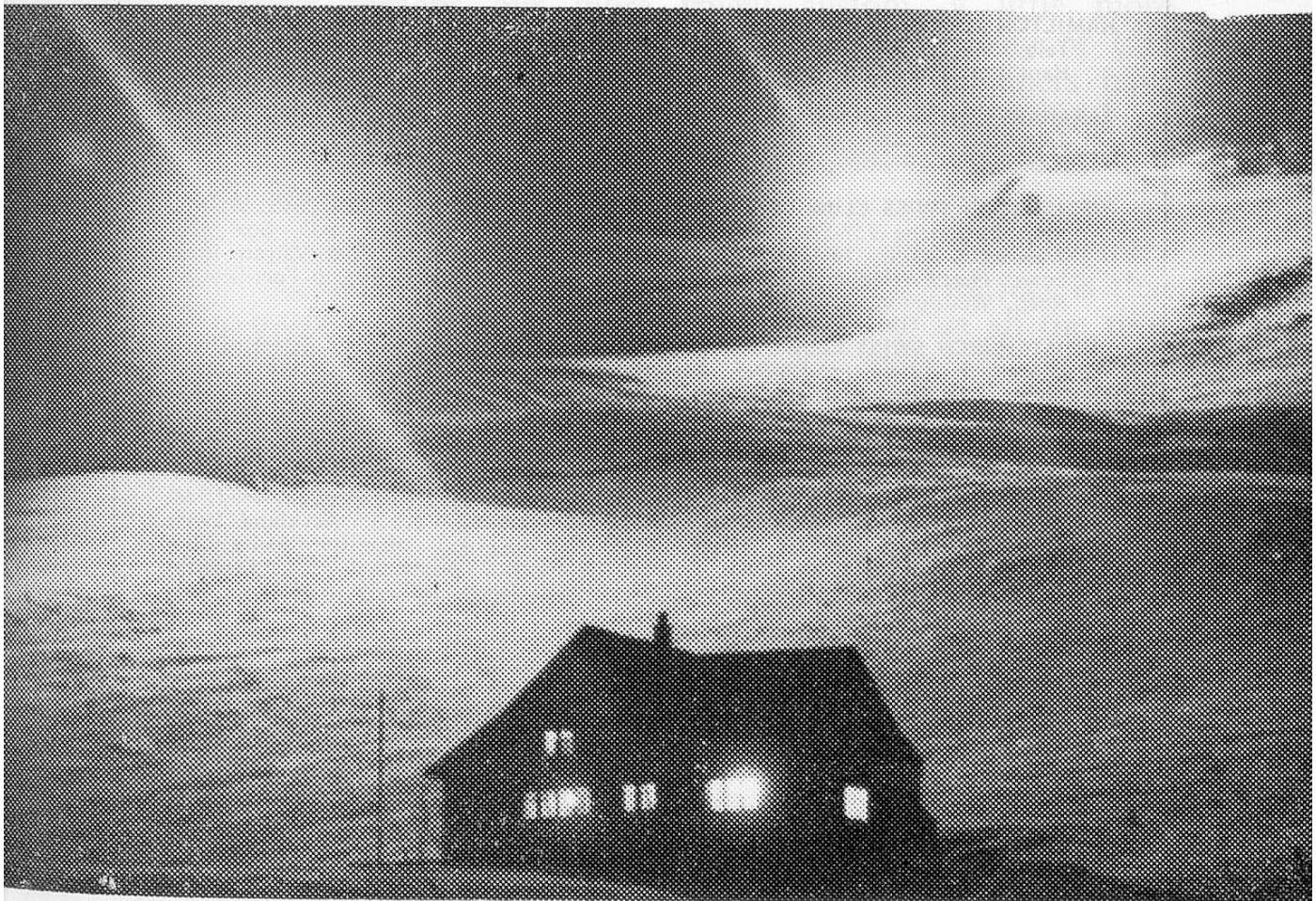
A view of the Swiss Alps by night.