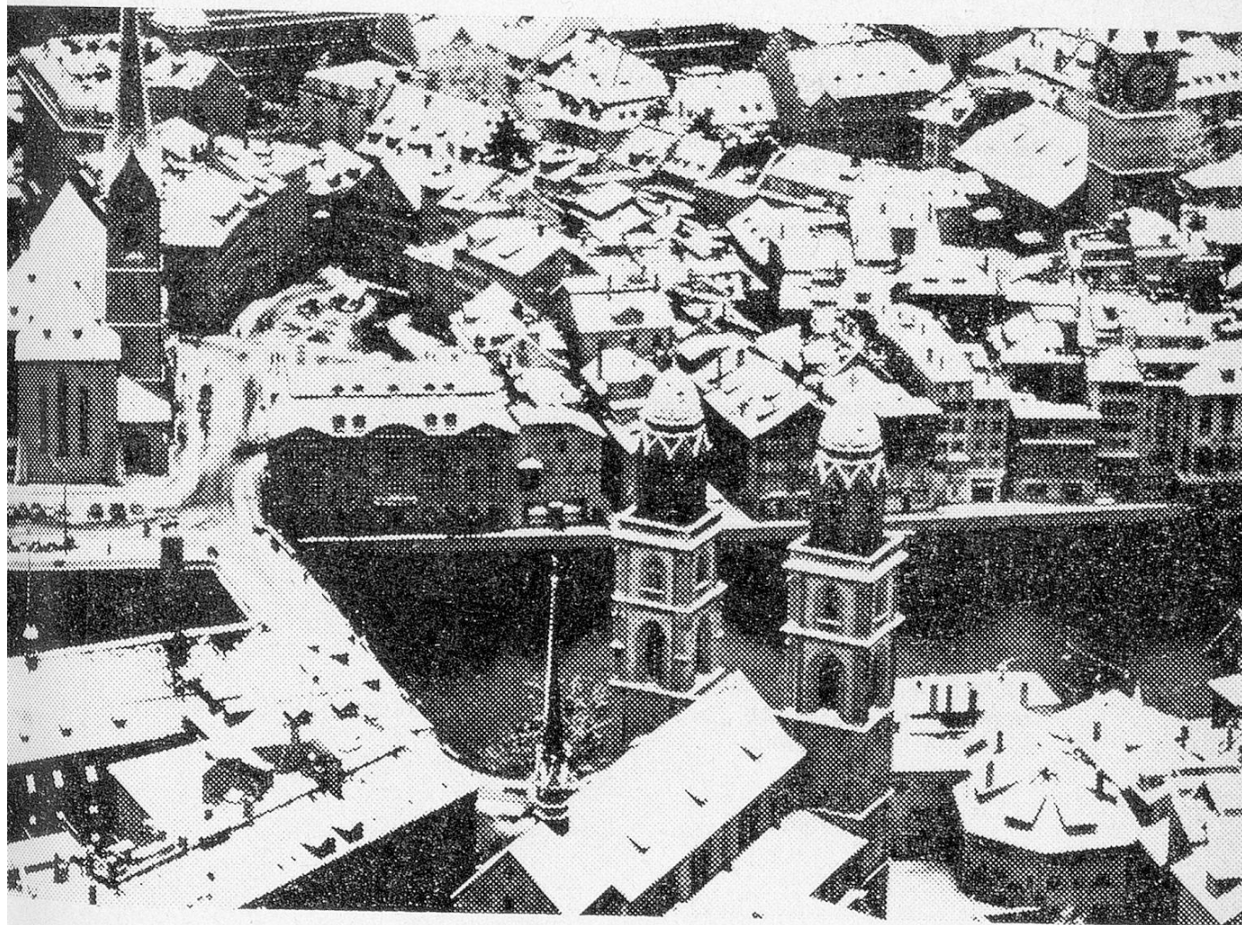
A view of Zurich.