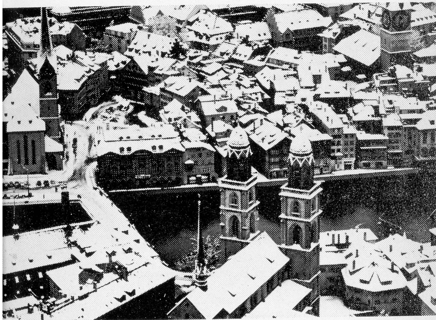
A view of Zurich.