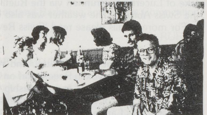
Der Besuch in der einstigen Heimat scheint Spass zu machen.

Auch jetzt noch muss in Neuseeland tüchtig zugelangt werden, wenn man es auf einen 'grünen' Zweig bringen will. Dies sagte ein jüngerer Mann, der in Christchurch ein Geschäft für Auto-Zubehör betreibt. Die Motorisierung ist in Neuseeland mit einem Fahrzeug auf 1,5 Einwohner noch dichter als in der Schweiz. Allerdings ist das öffentliche Verkehrsnetz viel weniger ausgebaut. Man sei schon stark auf das eigene Auto angewiesen, um irgendwohin zu kommen. Für die Neuseeländer gilt Tempo 100 und das findet der Mann gut so. Andererseits ist aber das Leben viel freier. Man könne auch mal aufs Land fahren und wilde Hasen schiessen.