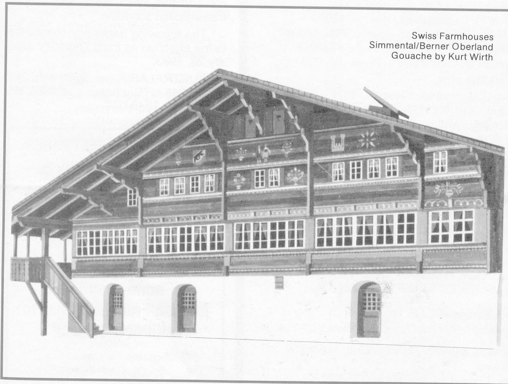
Swiss Farmhouses Simmental/Berner Oberland Gouache by Kurt Wirth

(Registered at the G.P.O. Wellington as a Magazine) Monthly Publication of the Swiss Society of New Zealand (Inc.) Group New Zealand of the Helvetic Society