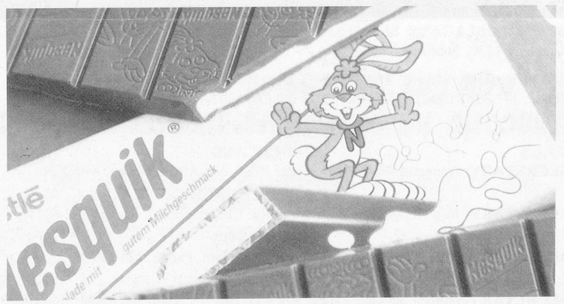
Happy chocolate bunny bar.

The Nesquik bunny will feature in all media campaigns, whether newspapers, TV, comic strips or cartoons. In Germany for example, he is the star of a video game designed to develop concentration and quick reactions. In Belgium, he sponsors the Antwerp zoo and in Korea, the bunny gives a welcome boost to road safety and environmental protection.