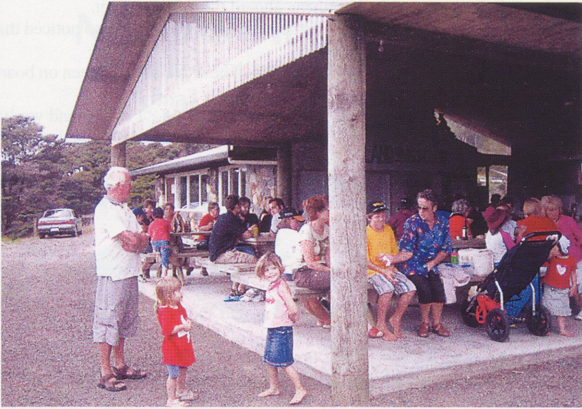
Above: Part of the crowd at the Auckland Swiss Club picnic, at the farm.