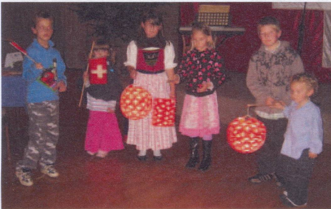
Auckland: Lampion parade