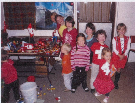
Wellington: Children's play table on 1st August evening