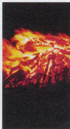
Petone Beach fire