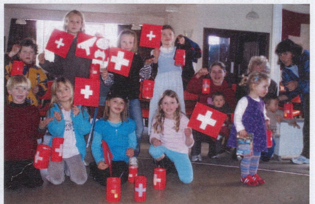
Children ready for the night