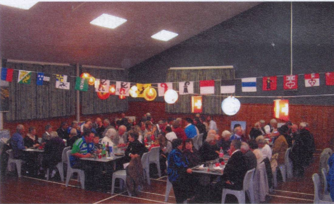
Hamilton: Group of about 100 at 1st August dinner