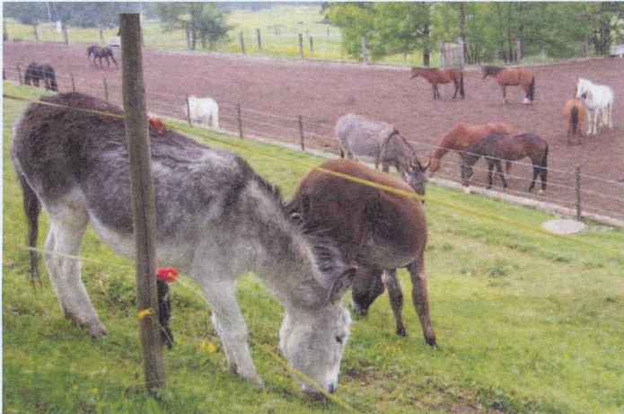
Retirement home for horses and donkeys at Le Roselet

The Foundation for the Horse is a refuge for horses, ponies and donkeys. Some 170 animals live in the foundation's three "homes" in Le Roselet, Jeanbrenin and Maison Rouge. They live out their days in the meadows of the Jura mountains.