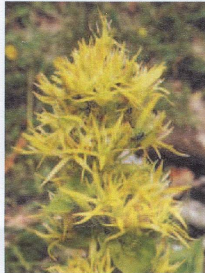
Great Yellow Gentian

Gentiana lutea (Great Yellow Gentian) is a species of gentian native to the mountain of central and southern Europe. Other names include 'Yellow Gentian', 'Bitter Root', 'Bitterwort', 'Centiyane', and 'Genciana'. It is a herbaceous perennial plant, growing to 1-2 m tall, with broad to elliptic leaves 10-30 cm long and 4-12 cm broad. The flowers are yellow. It grows in grassy alpine and sub-alpine pastures, usually on calcareous soils.