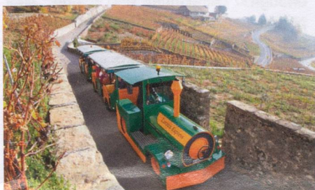
Lavaux Express