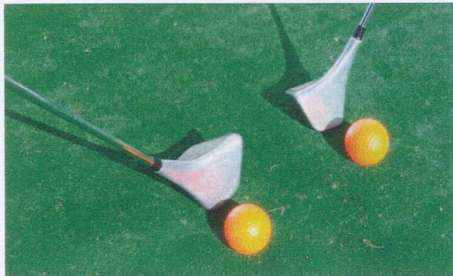
Swin golf clubs www.myswitzerland.com

http://www.neuchatel-tourisme.ch/en/leisure-activities/fun-co/