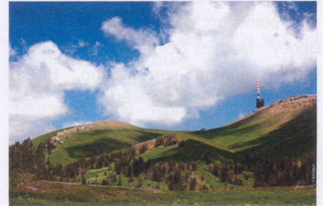
Mount Chasseral