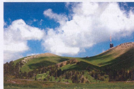
Mount Chasseral