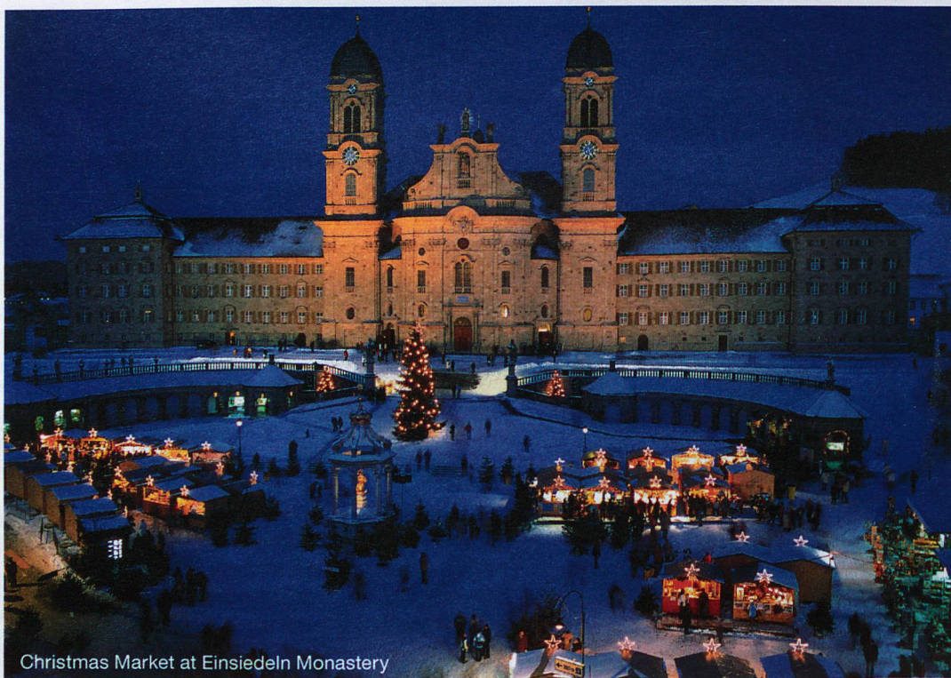
Christmas Market at Einsiedeln Monastery