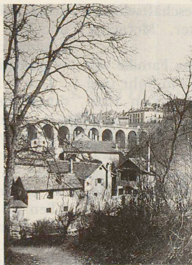
Der Grand-Pont um 1870: Infrastrukturverbesserung für das «Vallée du Flon».

Der Ideenwettbewerb «Vallée du Flon» in Lausanne scheint zu einem Hornberger Schiessen für Architekten zu werden: Parallel zum Wettbewerb wird nämlich das Thema von Direktbeauftragten bearbeitet.