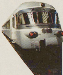
Aus dem TEE wird der EC-Zug: Schweizer Qualität S. 28