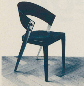
Die Schweizer Möbel- messe in Bern S. 71