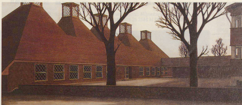
Erweiterung der Kirche Egg: Perspektive.