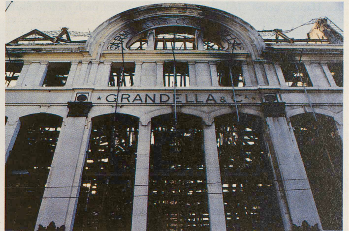
Das ausgebrannte Warenhaus Grandella (links und oben) im Lissaboner Altstadtviertel Chiado ist Teil der Unterstadt aus dem 18. Jahrhundert und zum «Kulturgut von nationalem Interesse» erklärt.