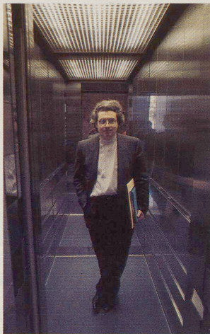
Der Lift als spielerisches Element: Mario Botta scherzt mit dem Licht und mit den Leuten.

In einem Bankverwaltungsgebäude wie dem der Luganeser Banca del Gottardo erfülle der Lift eine dienstliche und keine öffentliche Funktion, erläutert Botta. Deshalb handle es sich auch um einen «traditionellen» Aufzug, eingepasst jedoch in die Ornamentik des ganzen Baus. Das horizontale Streifenmuster, das sich in verschiedenen Materialien immer wieder findet, ist in abwechselnd poliertem und mattiertem Chromstahl abgewandelt. Spieglein, Spieglein an der Liftwand, zum Zeitvertreib: Das Warten auf den Lift, diesen für viele peinlichen Moment, habe er spielerisch überbrücken wollen. «Hier können die «Ragazze» noch rasch ihre Maquillage korrigieren