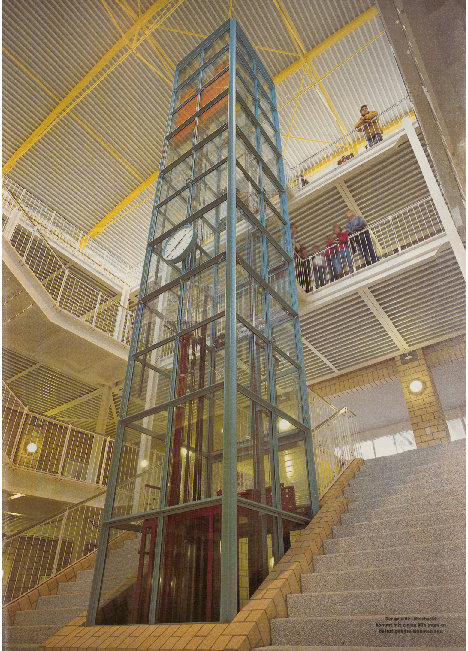
Der grazile Liftschacht kommt mit einem Minimum an Befestigungselementen aus.