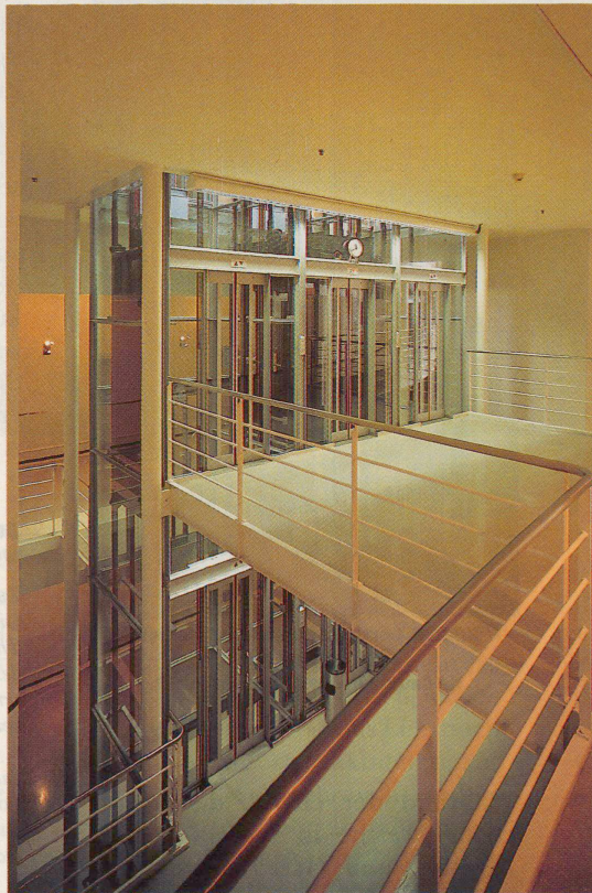
Der Glaslift im Berner Amthaus: Aus der Situation bedingter architektonischer Dialog zwischen dem renovierten Altbau und dem Erweiterungsbau aus heutigen Materialien.

Nur: Ist die Funktion des Liftes nicht selbst ein Stück weit Spektakel? Genügt die Absicht, Bewegung erlebbar und Technik sichtbar zu machen, nicht als Begründung? «Liftfahren ist kein Risiko, aber es soll ein Erlebnis sein», be-