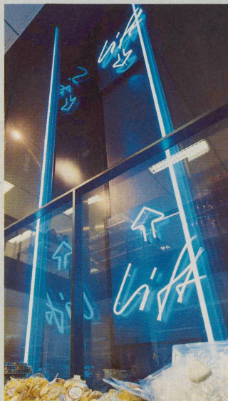
Spektakuläre Neonröhren erfüllen eine funktionsfremde Aufgabe: Locken statt Liften.

Grellblaue Neonröhren, Richtungs- pfeile und die Leuchtschrift «Lift»: Im Coop-Supermarkt im Luzerner Löwencenter muss der Lift auf sich selber aufmerksam machen, als Schlagzeile, dort, wo eigentlich das «Angebot des Tages» anzupreisen wäre. Weil hier für eine Treppe zum ersten Stock (der Laden ist nur zwei- geschossig) der Platz fehlte, ent- schied sich Architekt Hans Zwim- per für einen «Kundenhubstapler». Zwischen den vollgestopften Ver- kaufsregalen kommt das Licht- und Liftspiel allerdings nicht so richtig zur Geltung. Auch täuschen die ver- tikalen Leuchtröhren, unterstützt durch den Pfeil nach oben, eine Hö- hendimension vor, die es gar nicht gibt. Problematisch zudem die hori- zontale Orientierung des Kunden: Dass der Zugang zum Lift rückseits – im Einkaufswagenlalom zwischen Schokolade und Waschpulver – ge- sucht werden muss, sagt ihm die spektakuläre Vorderseite nämlich nicht.