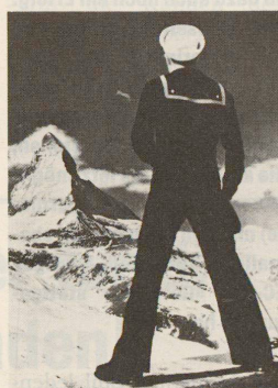
Heimatszenen – Schauplätze des Schweizer Films. Seite 38