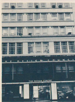
Londons Haymarket: Sitz des British Design Council, der grössten staatlichen Designförderungsstelle. Seite 53