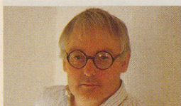
Gestalter Bruno Rey erfand den Stuhl, auf dem fast jeder schon einmal gesessen hat. Seite 30