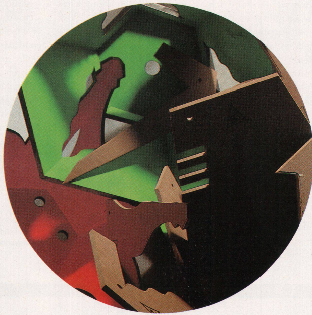
Hannes Wettsteins Spider: Experimentieren mit Holz