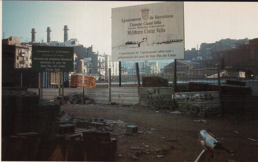
Abbrechen, sanieren, neu bauen: «Verbesserung» der Altstadt

Barcelona auf Neues: Im Poble Nou, dem olympischen Dorf, wo ein Konsortium eben erst mit Bauen begonnen hat, wird auf 47 Hektaren ehemaligem Industrieland das erste dem Meer zugewandte Barceloneser Wohnquartier entstehen: die «Copacabarna» («Barna» als Abkürzung für Barcelona). Hier kostet eine mittlere 62-Quadratmeter-Wohnung mindestens 16 Millionen Peseten (220 000 Franken). Die Preisspanne, zwischen 130 000 und 750 000 Franken, ist für Spanien enorm. Wer jetzt kauft, muss 10 Prozent anzahlen. Beim Bezug 1993 müssen 30 Prozent Eigenkapital eingebracht sein, den Rest finanzieren die Banken bei 15 Prozent Hypozins. 1813 Wohnungen werden gebaut, davon will die Stadt 450 günstig weitergeben. 570 der Wohnungen, die erst auf dem Papier existieren, wurden diesen Sommer als erste zum Verkauf angeboten. Fast 2000 Interessenten meldeten sich, doch die Neugier war grösser als die Kaufkraft. Die Golfkrise habe die Kauflust zusätzlich gebremst, bedauert das Konsortium. Bisher gingen nur die teuersten Wohnungen weg und nur die der berühmten Architekten. Prestige auch hier: Wer es sich leisten kann, wohnt dann in einem echten Bofill. Die rund 6000 Bewohner des künftigen Quartiers werden zu den gut situierten gehören. Damit sich der Kreis öffnen kann, hat Jordi Pujol, konservativer Präsident der katalanischen Provinzregierung, einen speziellen Wohnbeihilfenplan vorgestellt.