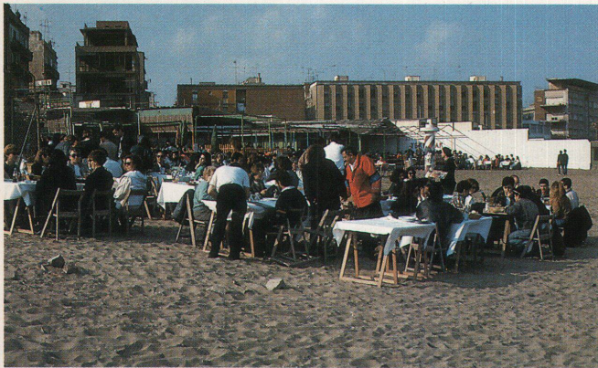
Bald Nostalgie: die Sandbeizlein am Hafen

Das entspricht den Zielen der Stadtentwickler: Barcelona muss eine weltstädtische Promenade am Quai bekommen. Zitiert werden die Vorbilder in Baltimore, Boston, Toronto und New York, aber auch Stadtplanungen von Berlin, Paris und Rom. Barcelona braucht eine leistungsfähige neue Strasse vom Flughafen in die Stadt (die auf die Olympiade doch nicht mehr fertig wird) und eine entlang der Uferlinie, dimensioniert für bis zu 100 000 Fahrzeuge pro Tag. Man braucht Parkhäuser und «Luft» in den Altstadtquartieren. Die Olympiade ist der Anlass, diese Ziele im Schnellzugstempo zu erreichen: All die Sportanlagen in der Peripherie, alle verbindenden Strassen, das olympische Dorf (Poble Nou), das nach den Spielen zum Nobelquartier mit Meeranstrich wird, die Promenade dort, der neue Jachthafen,