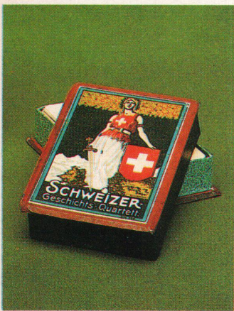
Der Mythos Mutter Helvetia – hier als historisches Quartettspiel

Still und leise sind in den letzten Jahren Museumseingänge umgebaut worden. Statt Garderobe Cafeteria mit Bücherstand und statt eines Schalters mit Museumswärter eine Bartheke mit Museumsfräulein. Im Schweizerischen Museum für Volkskunde in Basel ist das noch anders. Es gibt zwar auch ein Café mit einem schönen Innenhof, vor allem aber gibt es hier noch einen Schalter, hinter dem, geschützt von einem Flügel Fenster, ein Museumswärter mit weissem Bart sitzt und gewichtig für die drei Franken Eintritt ein Billett herausrückt. Noch bis Ende Jahr wird hier in einer Ausstellung die Frage gestellt: «Typisch? Objekte als regionale und nationale Zeichen».